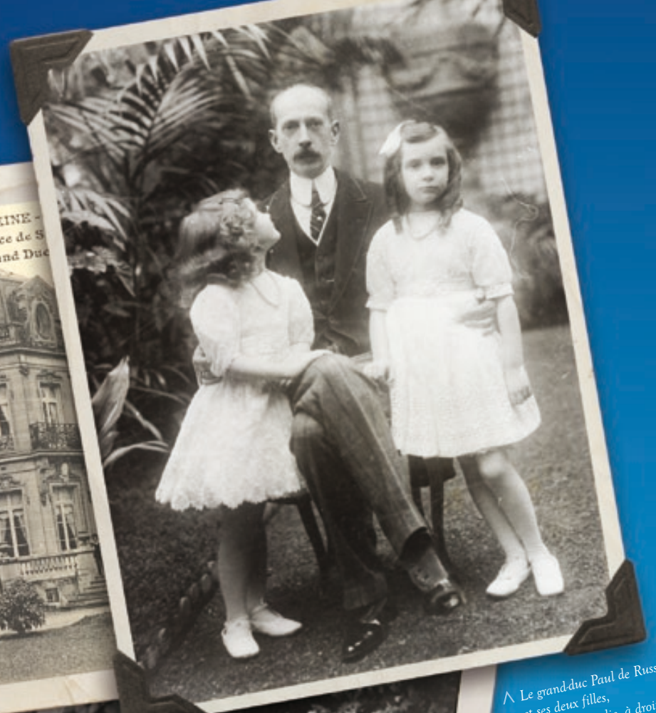
^ Le grand-duc Paul de Russie et ses deux filles, à gauche Natalie, à droite, Irène.