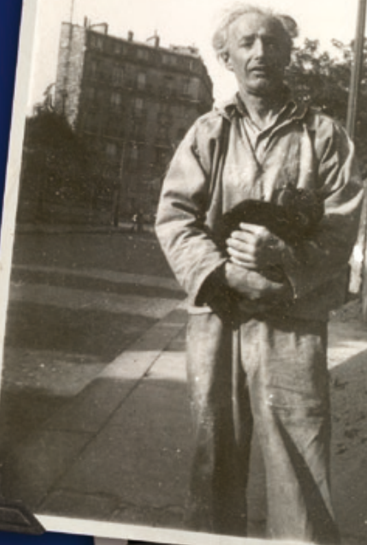
< Le sculpteur Nathan Imenitoff rue du Château, on aperçoit à l'arrière-plan la place Denfert- Rochereau © Gefman.