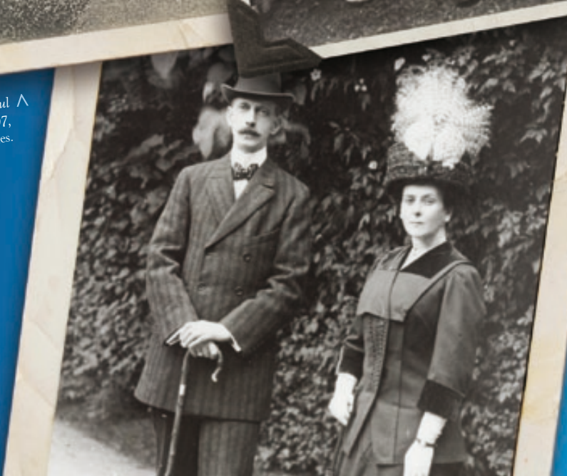
> Le grand-duc Paul de Russie et sa seconde épouse la princesse Paley en 1911 © Collection Cyrille Boulay.