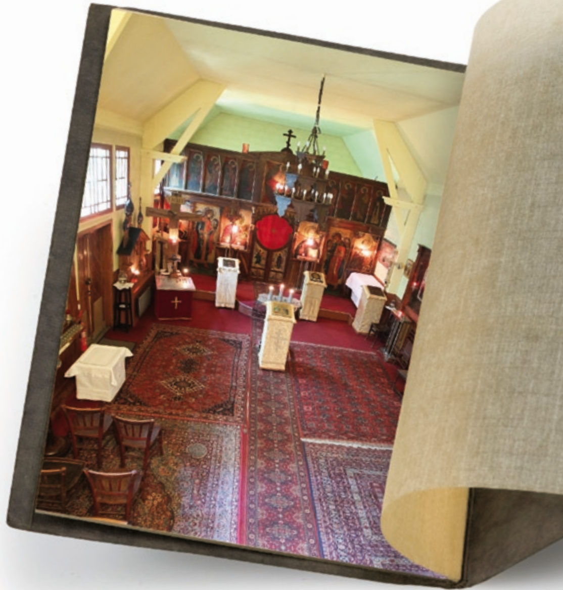
^ Intérieur de l'église Saint-Nicolas-le-Thaumaturge © Bahi.