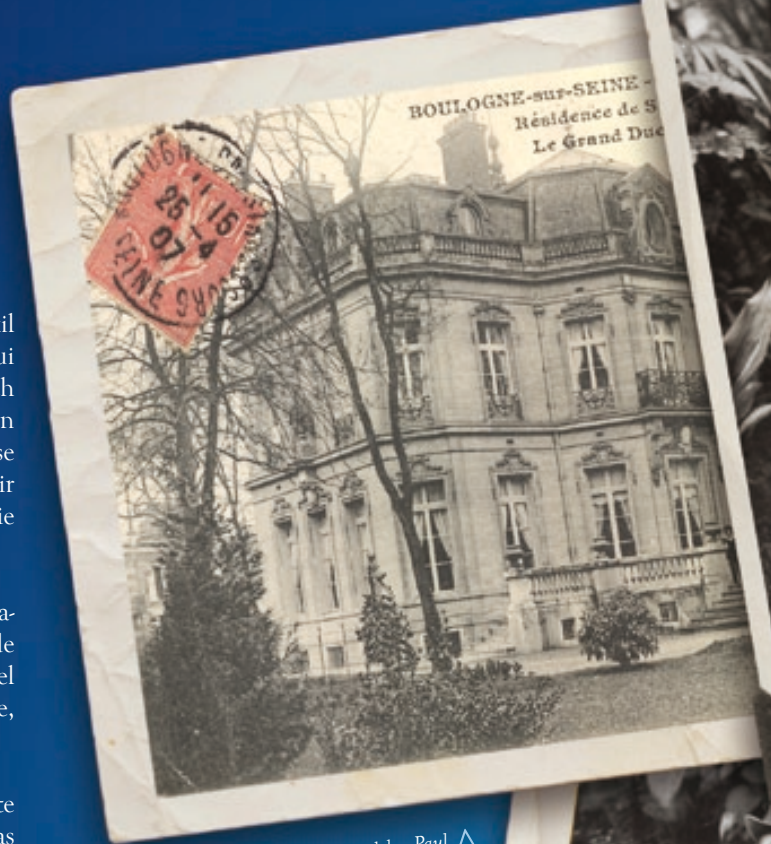
^ Résidence du grand-duc Paul à Boulogne en 1907, Boulogne-Billancourt, Archives municipales.

Après la mort tragique de son mari, fusillé par les bolcheviks, la princesse Paley revient en France et vend en 1921 l'hôtel de Boulogne à une congrégation religieuse qui prend alors le nom de Cours Dupanloup.