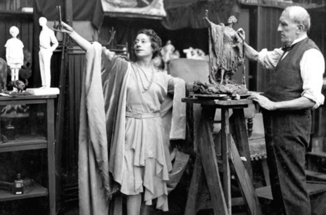
^ Le sculpteur Troubestkoy.